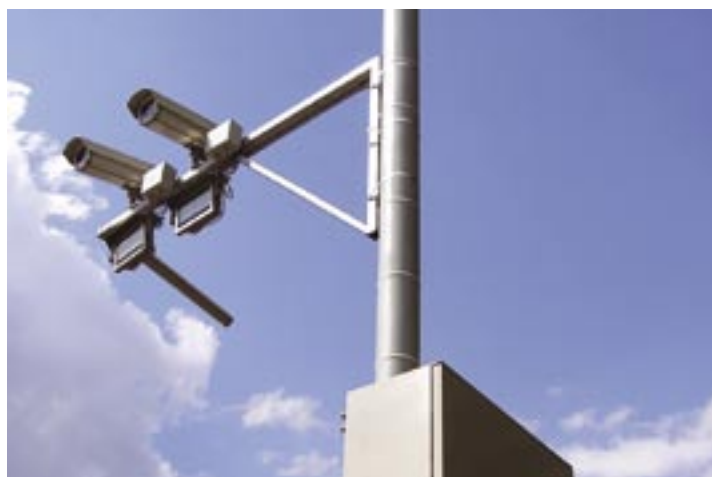
Instalace UnicomREDLIGHT na sloupu VO

Systém UnicomREDLIGHT je nejrozšířenější systém v ČR s více než 85 monitorovanými jízdními pruhy.