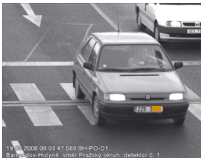
Detailová kamera sleduje jeden jízdní pruh