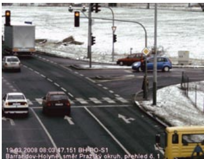
Přehledová kamera sleduje prostor v celé křižovatce

Jedná se o původní český výrobek vyvinutý a vyráběný firmou CAMEA, spol. s r.o. ve spolupráci s policií, správními orgány a vysokými školami. Systém prochází neustálými inovacemi a současné řešení představuje již třetí generaci zohledňující jak technologický pokrok, tak především zkušenosti s jeho dlouholetým použitím v praxi. Pořízení přestupku je plně automatizovaná činnost, což eliminuje vliv lidského faktoru. K průkazné dokumentaci jízdy na červenou se využívá dvojice kamer – přehledové, zaznamenávající chování řidiče před vjezdem do křižovatky, a detailové, pro rozpoznání SPZ/RZ vozidla a tváře řidiče.